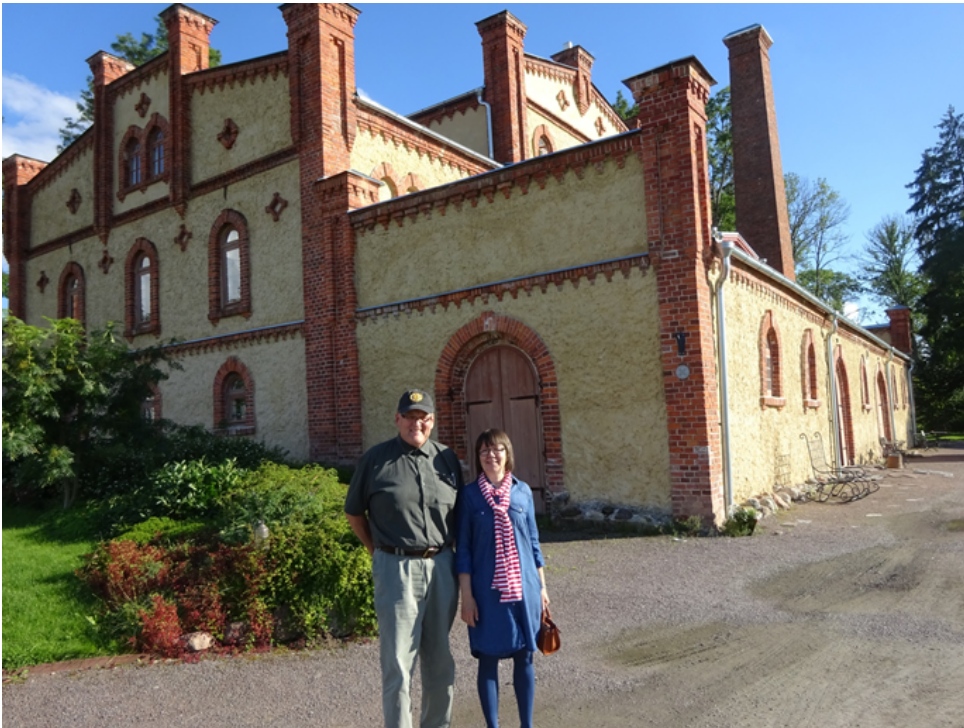
Hotelli „Viinavabrik“ Moosten kartanokompleksissa