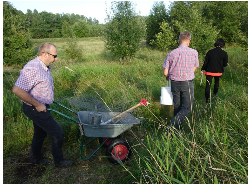
Mälestustammede istutamine Karste tammikus pärast seminari